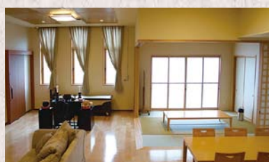
虹のホール家族ルーム