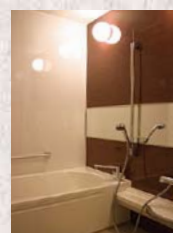
ユニットバスルーム