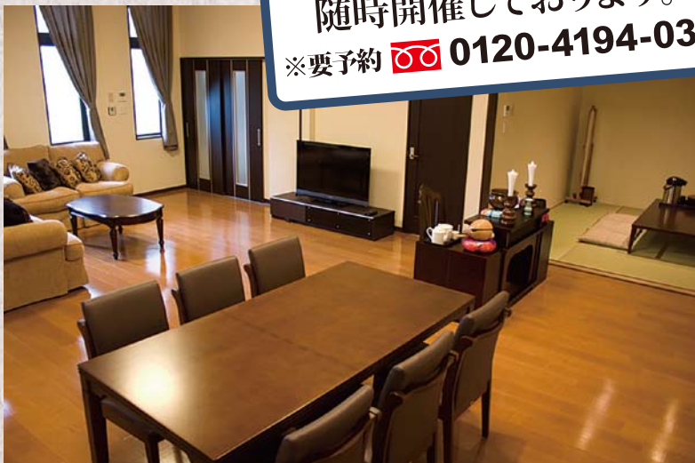
風のホール家族ルーム