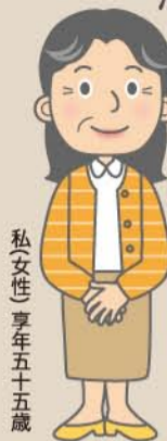
私(女性)享年五十五歳